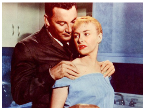
1957 LES SENSUELS (No Down Payment) de Martin Ritt avec Tony Randall