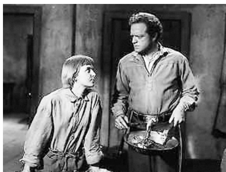
1955 COUNT THREE AND PRAY de George Sherman avec Van Heflin