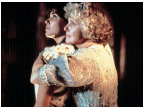
1987 LA MÉNAGERIE DE VERRE (The Glass Menagerie) de Paul Newman avec Karen Allen