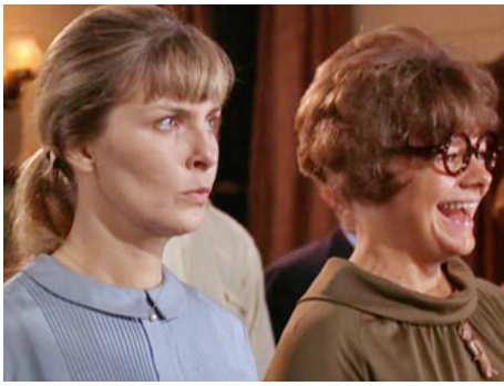
1968 RACHEL, RACHEL (Rachel, Rachel) de Paul Newman avec Estelle Parsons