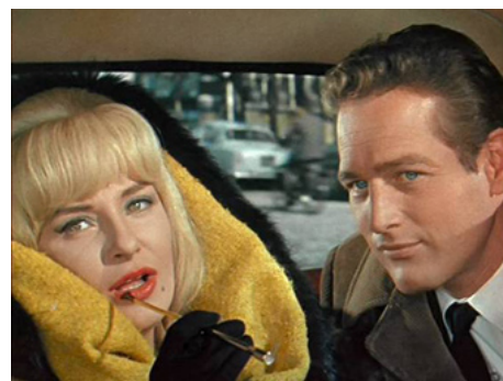
1963 LA FILLE À LA CASQUETTE (A New Kind of Love) de Melvin Shavelson avec Paul Newman