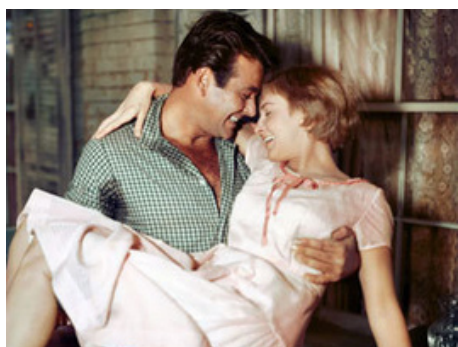
1959 LE BRUIT ET LA FUREUR (The Sound and the Fury) de Martin Ritt avec Stuart Whitman