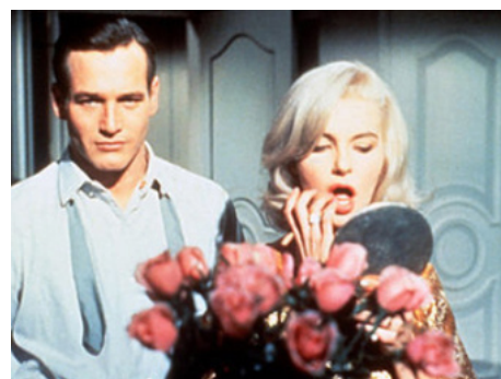
1960 DU HAUT DE LA TERRASSE (From the Terrace) de Mark Robson avec Paul Newman