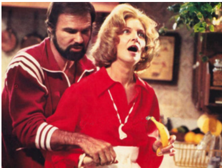
1978 SUICIDEZ-MOI, DOCTEUR (The End) de et avec Burt Reynolds