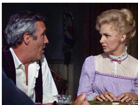
1966 GROS COUP À DODGE CITY (A big hand for the little Lady) de Fielder Cook avec Jason Robards