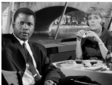
1961 PARIS BLUES (Paris Blues) de Martin Ritt avec Sidney Poitier