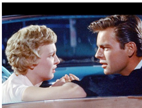
1956 BAISER MORTEL (A Kiss before dying) de Gerd Oswald avec Robert Wagner