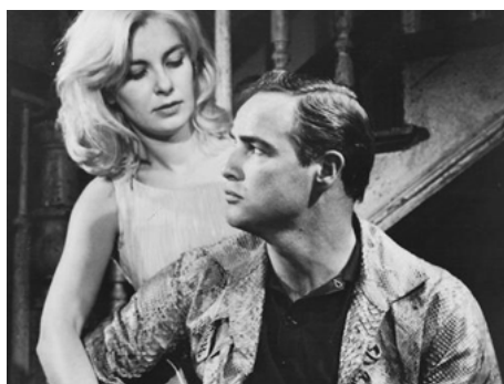
1959 L'HOMME À LA PEAU DE SERPENT (The Fugitive Kind) de Sidney Lumet avec Marlon Brando