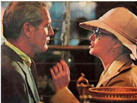
1975 LA TOILE D'ARAIGNÉE (The Drowning Pool) de Stuart Rosenberg avec Paul Newman