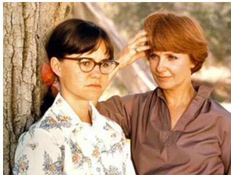
1976 SYBIL (Sybil) de Daniel Petrie avec Sally Field