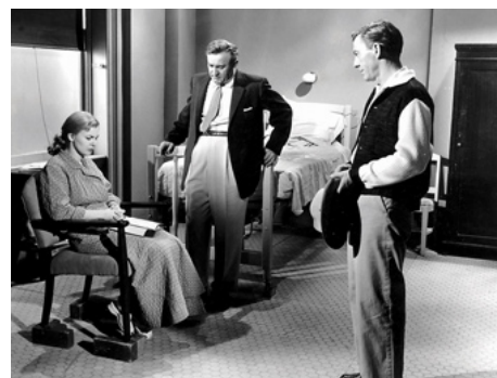
1957 LES TROIS VISAGES D'ÈVE (The 3 Faces of Eve) de Nunally Johnson avec Lee J. Cobb, David Wayne