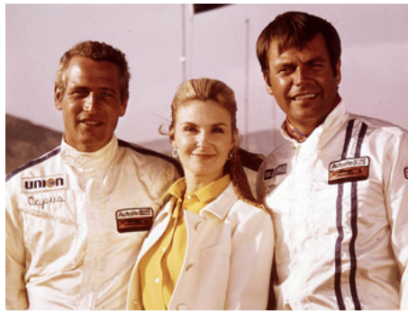
1969 VIRAGES (Winning) de James Goldstone avec Paul Newman, Robert Wagner