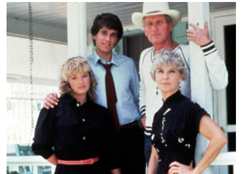
1983 L'AFFRONTLEMENT (Harry and Son) de P. Newman avec Ellen Barkin, Robby Benson, Paul Newman