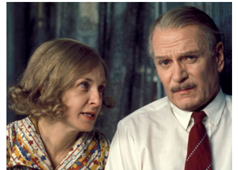
1977 REVIENS PETITE SHEBA (Come back, little Sheba) de Silvio Narizzano avec Laurence Olivier