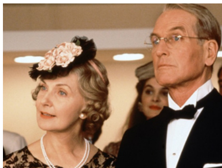
1990 MR & MRS BRIDGE de James Ivory avec Paul Newman