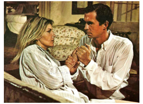
1970 WUSA (WUSA) de Stuart Rosenberg avec Anthony Perkins