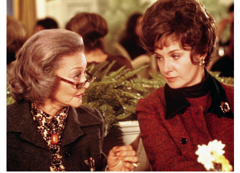
1973 SUMMER WISHES, WINTER DREAMS de Gilbert Cates avec Sylvia Sidney