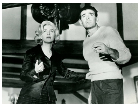
1964 SIGNPOST TO MURDER de George Englund avec Stuart Whitman