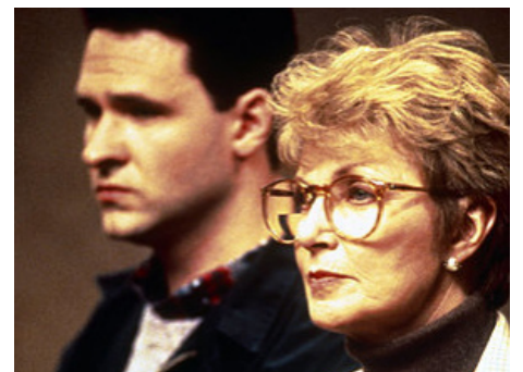
1993 PHILADELPHIA (Philadelphia) de Jonathan Demme avec Dan Olmstead