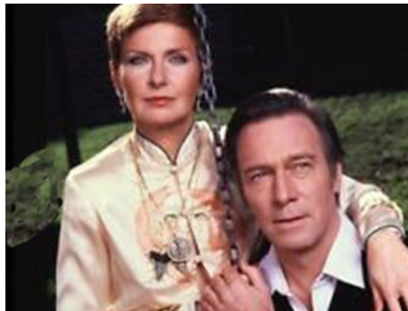
1980 THE SHADOW BOX (The Shadow Box) de Paul Newman avec Christopher Plummer