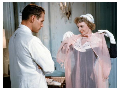
1958 LA BRUNE BRÛLANTE (Rally' round the flag, Boys) de Leo McCarey avec Paul Newman