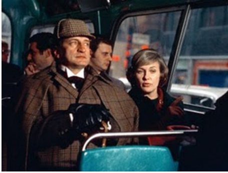
1971 LE RIVAGE OUBLIÉ (They might be Giants) d'Anthony Harvey avec George C. Scott