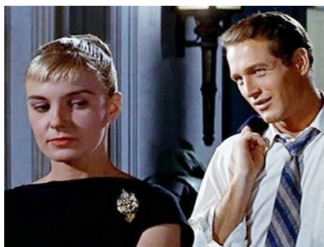
1958 LES FEUX DE L'ÉTÉ (The Long, hot Summer) de Martin Ritt avec Paul Newman