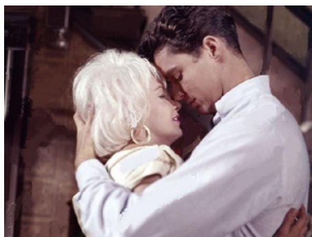
1963 LES LOUPS ET L'AGNEAU (The Stripper) de Franklin J. Schaffner avec Richard Beymer